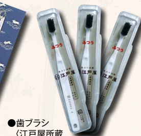
●歯ブラシ (江戸屋所蔵 刷毛ブラシ展示館)