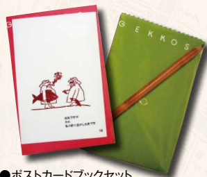
●ポストカードブックセット (月光荘画材展示館)