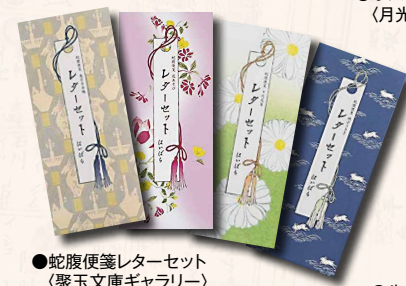
●蛇腹便箋レターセット (聚玉文庫ギャラリー)