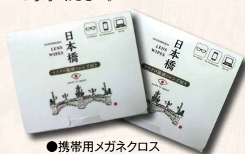
●携帯用メガネクロス (小津史料館)

※プレゼント商品はおまかせとなります。お選びいただくことはできませんので ご了承ください。